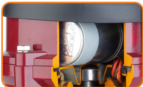
Indbygget motor beskyttelse